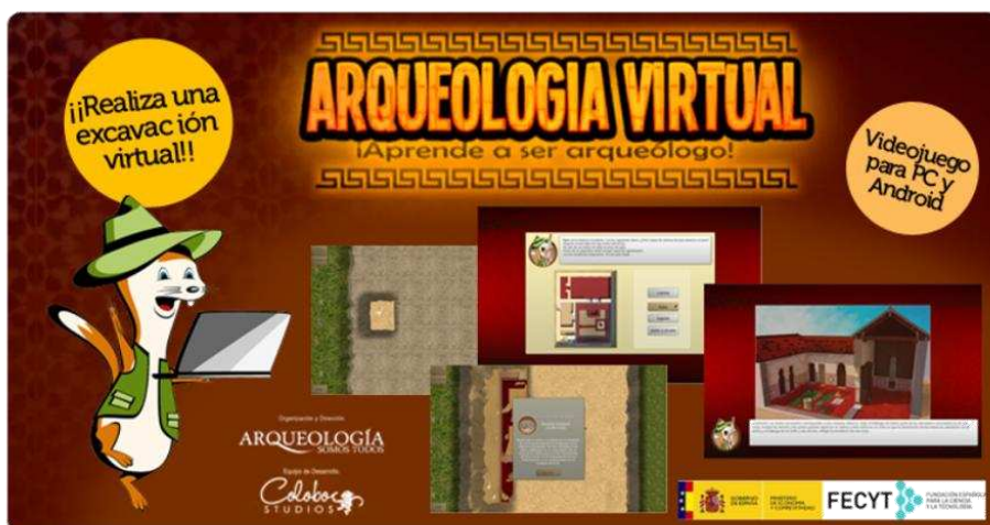
Pantallazo de presentación del juego didáctico Arqueología Virtual. Aprende a ser arqueólogo.

• Gymkana Virtual por el Casco Histórico. A través de esta gymkana fomentamos el trabajo en equipo y, en su caso, las actividades en familia, mediante el planteamiento de incógnitas que deben resolverse utilizando distintos métodos o ciencias auxiliares de la Arqueología. Los alumnos se dividen en varios grupos y, pertrechados con el “maletín del arqueólogo” –papel milimetrado, lápiz, lupa, brújula, cinta métrica, paletín, etc.-, deben recoger pruebas y responder las preguntas que les permitan alcanzar las distintas etapas del juego mediante el uso de una Tablet.