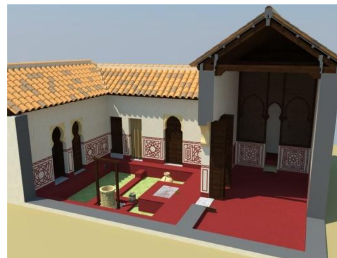
Recreaciones 3D realizadas con Sketchup de unos baños árabes, una necrópolis romana y una vivienda romana y almohade (Autor: José M º Tamajón).