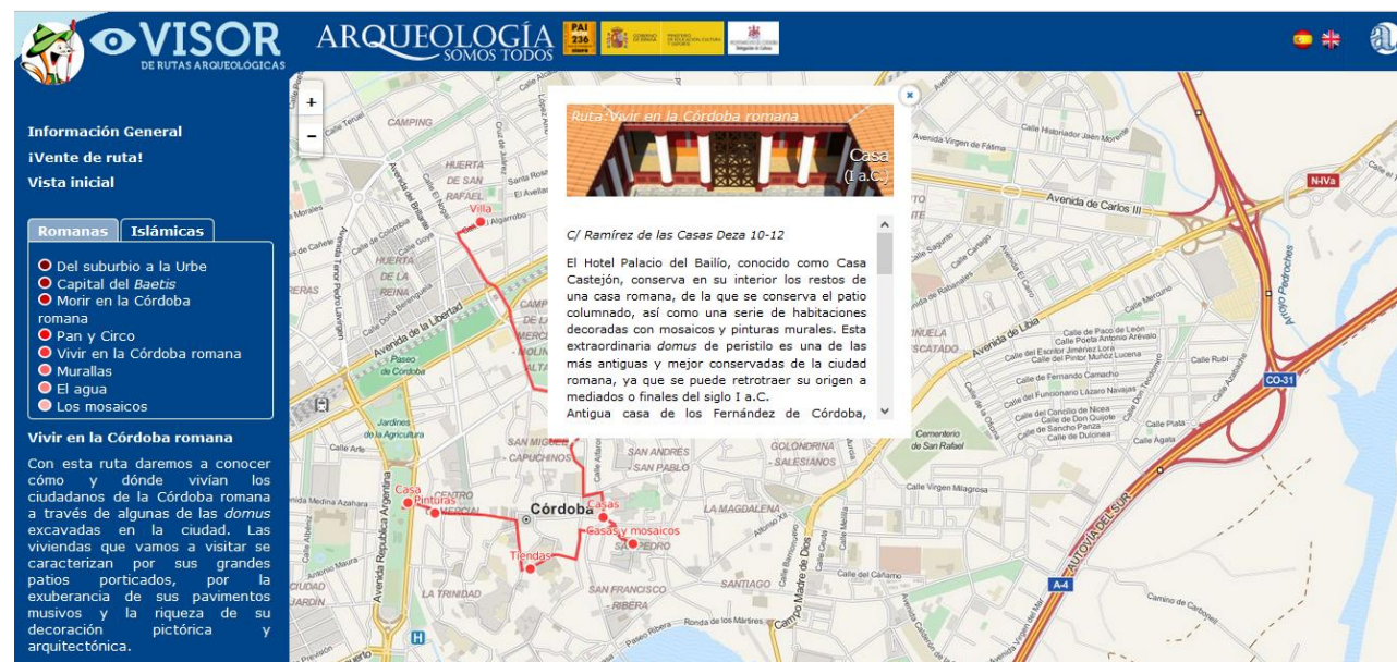
Visor de rutas arqueológicas por Córdoba.

• Visor de Rutas Arqueológicas. Realizado por la empresa Almagre con tecnología de código abierto sobre un callejero actual de la ciudad, y con un carácter interactivo y online , ofrece recorridos históricos virtuales de la Córdoba romana e islámica a través de nuestra web. Cada punto del mapa que marca el lugar en el que se encuentra un yacimiento o vestigio arqueológico está vinculado a una ficha técnica con información textual y gráfica en español e inglés ( http://www.arqueocordoba.com/rutas/ ).