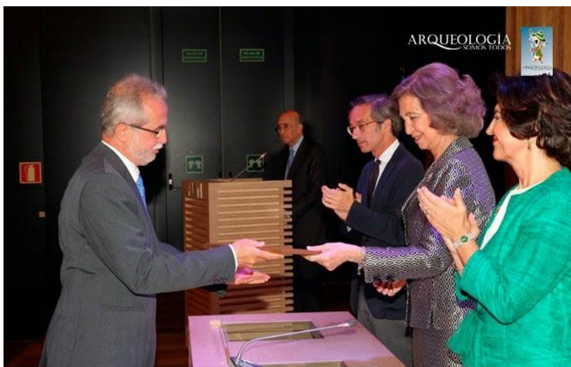
Entrega de la Mención Especial Europa Nostra por parte de S.M. la Reina Doña Sofía en la ceremonia organizada por Hispania Nostra en el Museo Arqueológico Nacional (Madrid)

El establecimiento de estas sinergias con diversos ámbitos sociales, públicos y privados, facilita y promueve la realización de nuestras iniciativas culturales y, además, refuerza día a día nuestra apuesta, consciente y decidida, por la divulgación de la Historia de Córdoba (Tablas 1 y 2). Así conseguimos, poco a poco, que la rica herencia cultural y patrimonial de Córdoba se mire con otros ojos, convirtiéndose en seña de identidad, motivo de orgullo y, sobre todo, en recurso de futuro, demostrándose también con ello que la